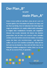
Plan A/B ___ Stück