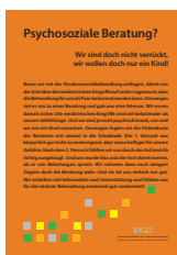
Beratung ___ Stück