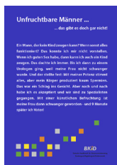
Männl. Infert. ___ Stück