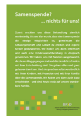
Samenspende ___ Stück