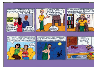
Comic lila ___ Stück