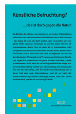
IVF? ___ Stück