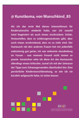
Kunstkoma ___ Stück