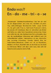
Endometriose ___ Stück

Versandkosten betragen von 1-20 Poster EUR 10,00 danach jedes Paket mit bis zu 20 Poster weitere EUR 10,00. Die Poster werden gerollt versendet. Bitte möglichst schnell nach Erhalt auspacken und flachlegen.