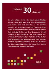
Alter ___ Stück